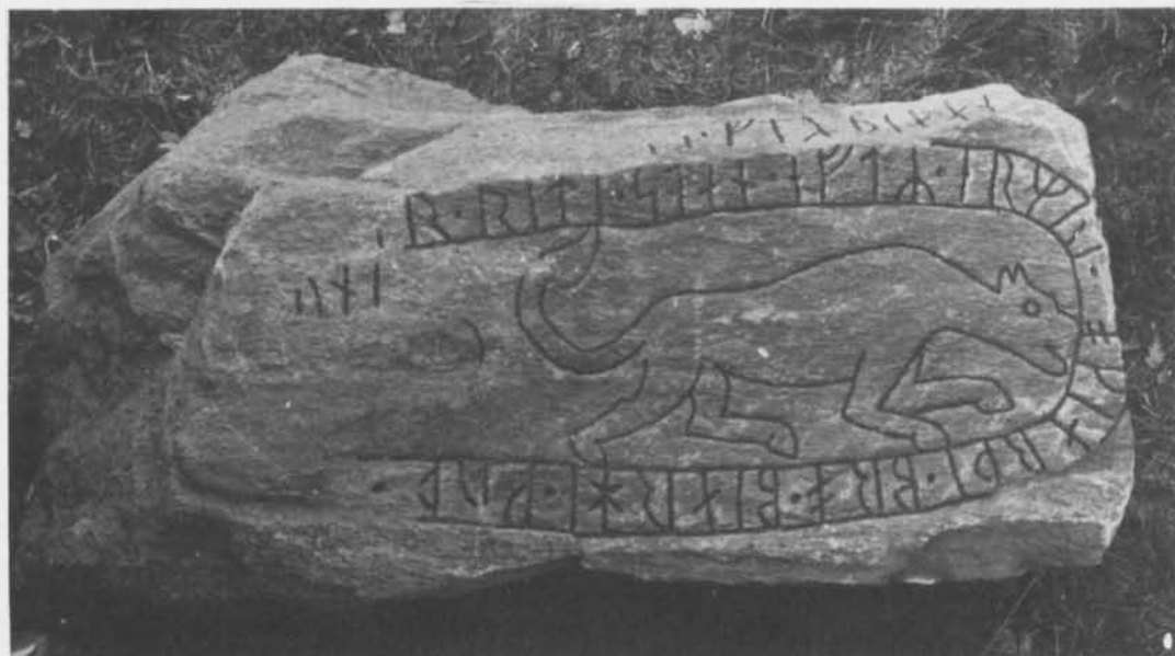
Fig. 4. Nyfunnen runsten vid Lejden, Ösby, Lunda sn, Uppland. Foto H. Gustavson 1978 (ATA). — Newly found rune stone at Lejden, Ösby, Lunda parish, Uppland.