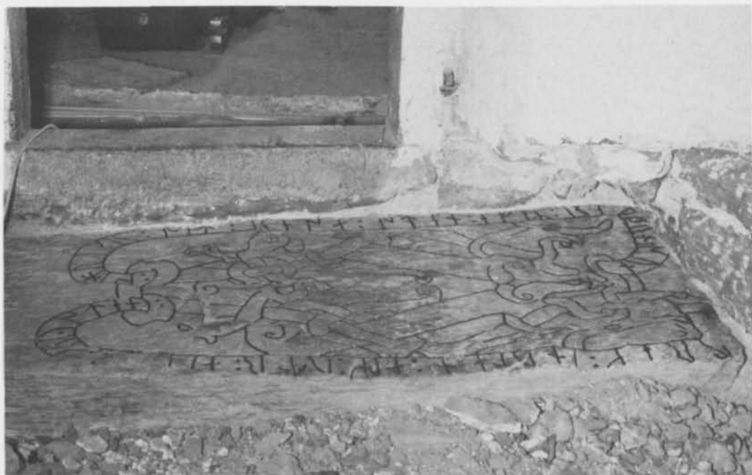
Fig. 1. Runstenen Nä 23 i sakristigolvet i Glanshammars kyrka, Närke fotograferad från sakristian. Foto E. Cornelius 1977 (ATA). — Rune stone Nä 23 in sacristy floor of Glanshammar Church, Närke; viewed from the sacristy.

Genom återfyndet berikas den vikingatida