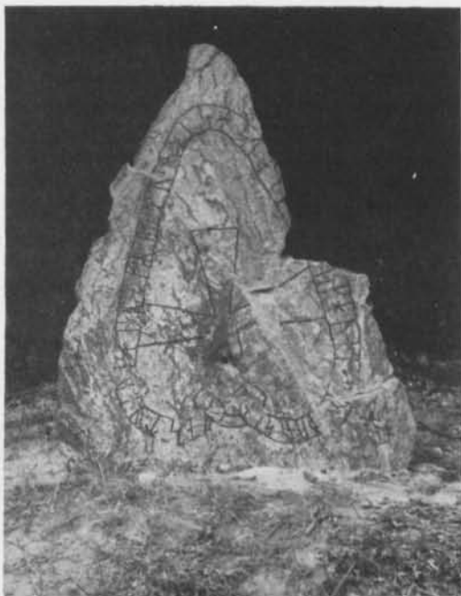
Fig. 2. Runstenen Sö 26 Ytterstene, Trosa-Vagnhärads sn, Södermanland. Foto H. Gustavson 1978 (ATA). — Rune stone Sö 26 Ytterstene, Trosa-Vagnhärads parish, Södermanland.

"Faste och hsbakr läto resa stenen efter Sigvat, sin broder."