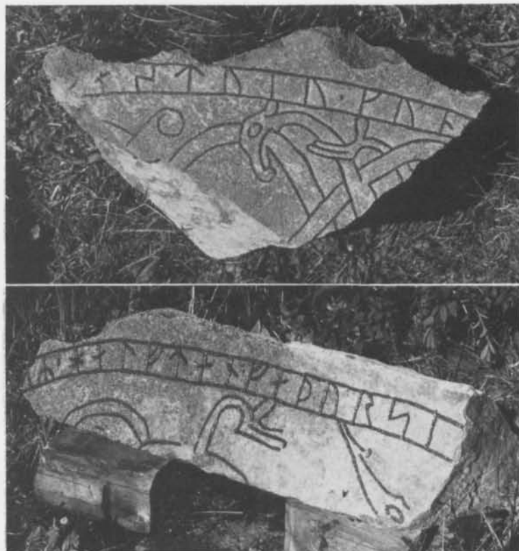
Fig. 3. Fragment av runstenarna U 1079 (överst) och U 1080 Forkarby, Bälinge sn, (nu vid Sundbro, Bälinge sn). Foto H. Gustavson 1978 (ATA). — Fragments of rune stones U 1079 (above) and 1080 Forkarby, Bälinge parish, Uppland (now at Sundbro, Bälinge parish).